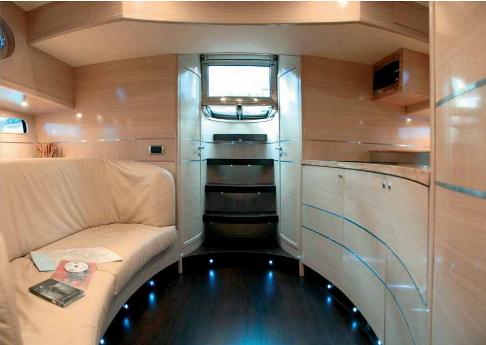
Sopra, un'inquadratura dell'open space che costituisce la zona giorno del Wake 46. Sotto, l'angolo cucina funzionale in stile minimalista