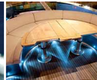
Sopra, particolare del pozzetto allestito con un grande divano a C e tavolo antistante. Sotto, invece, la barca inquadrata di prua