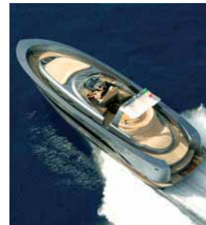
Sopra, una vista dall'alto del Wake 46. In basso, è in evidenza la configurazione walkaround dei passavanti