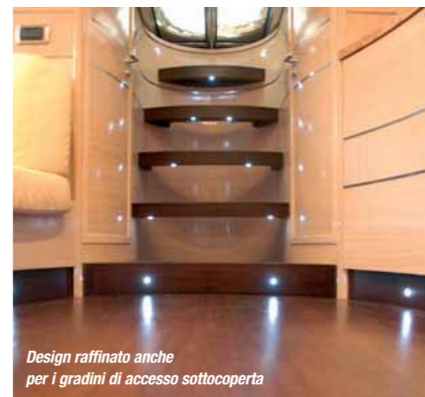
Design raffinato anche per i gradini di accesso sottocoperta