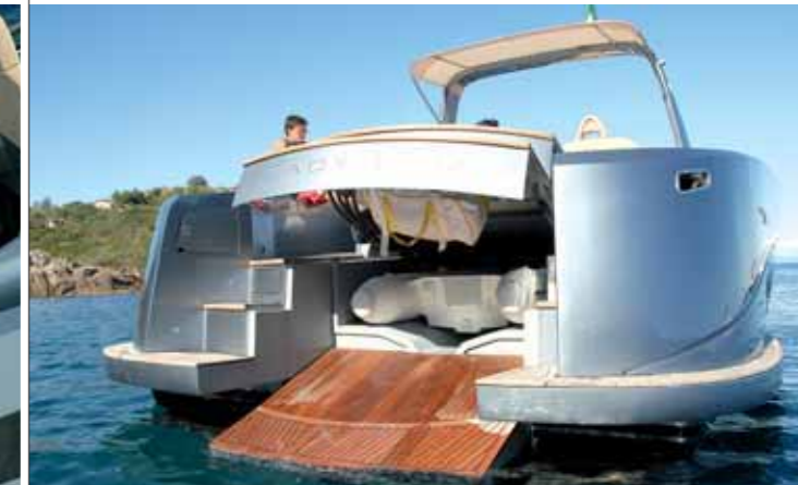
A sinistra, la chaise longue che si affaccia sullo specchio di poppa. Sopra, il tender può essere facilmente alato facendo scendere al livello dell'acqua la plancia di poppa

con una funzionale dinette con angolo cottura e tavolo semicircolare. La cabina amatoriale, servita dal proprio bagno, è a prua mentre la cabina degli ospiti, anch'essa dotata di bagno completo, è a poppa. In entrambe l'altezza è molto buona, gli spazi sono ben ottimizzati e la scelta di colori interni, chiari e lineari, è piacevole. La versione a due cabine è estremamente comoda e spaziosa, dotata di zone di stivaggio in misura ottimale; esiste, altrettanto confortevole, anche una versione del Wake 46 che offre la disponibilità di due cabine ospiti oltre a quella armatoriale. I materiali utilizzati sono pregiati e naturali: pelle naturale per le sedute, rovere sbiancato nell'impiallacciatura dell'arredo e delle paratie, pagliolo in wengé